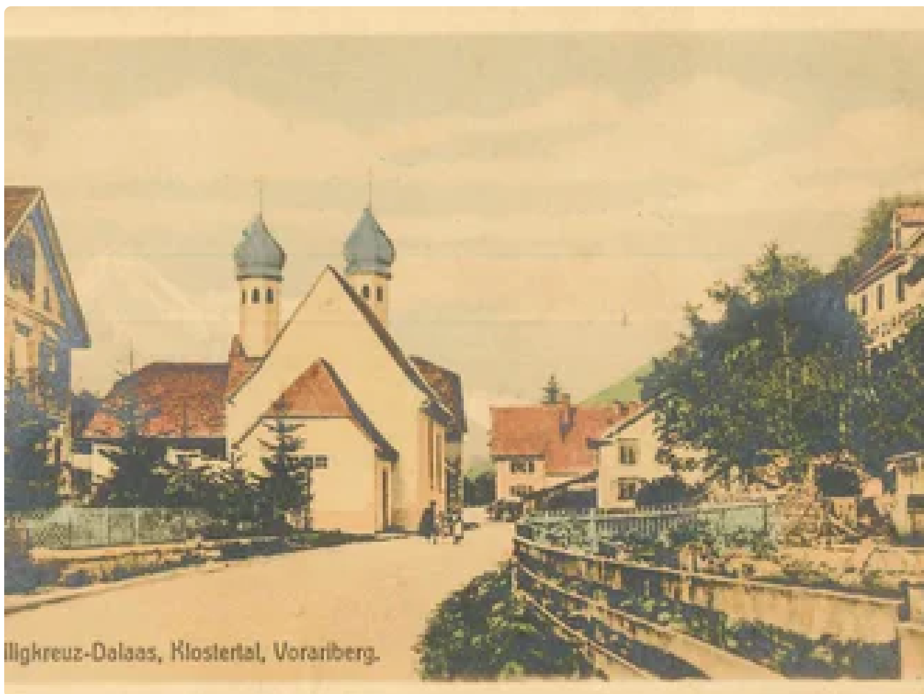
Illigkreuz-Dalaas, Klostertal, Vorarlberg.